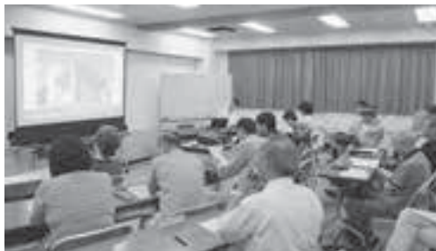
③まちを知る、地域から学ぶ 一橋大学大学院生講座