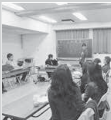
②「生きづらさ」を抱える若者が社会や他者とつながり、支え合っていく取り組み —中高生のための学習支援—