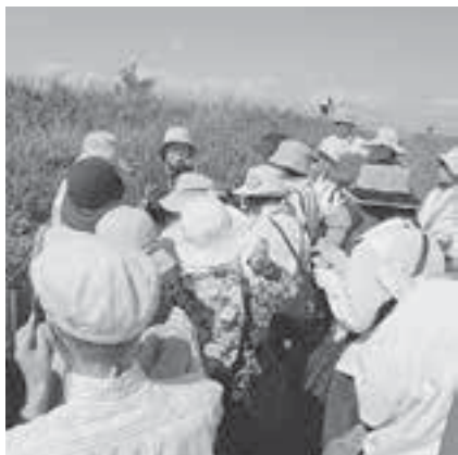
②共生の地域社会を育む シルバー学習室