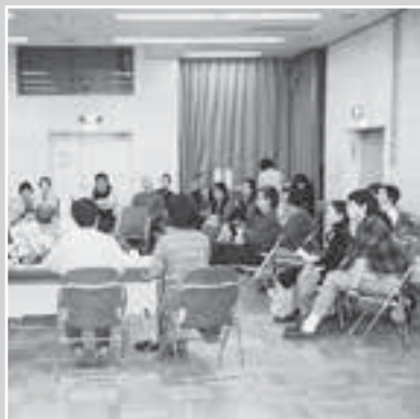
③公民館60周年を記念した取り組み —公民館30周年の式典—

今年には公民館開館60年目であると同時に、戦後70年目にもあたります。改めて「平和」と「人権」の視点から、歴史をふり返り、未来を展望する記念事業を市民主体でつくっていくために、4月から60周年記念事業実行委員会を立ち上げました。またこの節目に、公民館の活動をもっと多くの方に知っていただくために、映像や冊子の制作をはじめとする記録と情報発信の取り組みを開始しています。引き続き、実行委員を募集していますので、多くの市民のご参加・ご協力をお願いします。 第2回実行委員会：5月13日(水) 夜7～9時【申込・問合先 公民館 ☎(572) 5141】