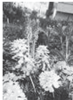
←ムスカリ、イペリス