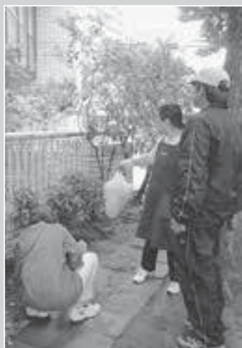
①公民館の施設環境の改善整備の取り組み —緑化活動—